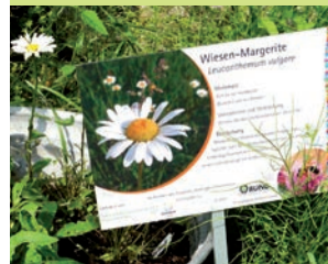
Informationen über Wildbienen und ihre Nahrungspflanzen

Im Rahmen des BUND-Projektes „Blühendes Rheinhessen – Farbtupfen für Wildbienen“ ** wurden die Grünen Klassenzimmer um vier Flächen in der Gesamtgröße von 10.200 qm erweitert. Um sie zu artenreichen und attraktiven Wiesen zu entwickeln, wurden sie grundsaniert und mit einer Heusaat aus regionalen Beständen behandelt.