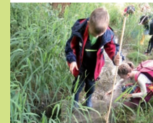
Kinder entdecken den Lebensraum Bach

Das Quellgebiet des Ochsenbaches im Michelstal bei Sulzheim ist eines der wenigen Feucht- und Sumpfgebiete in der Region und daher besonders schützenswert.