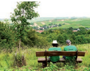
Natur erleben mit allen Sinnen

Aus landwirtschaftlichen Brachen entwickelten wir seit Mitte der 90er Jahre – ab 2001 auch in Zusammenarbeit mit der AGENDA-BUND Mensch & Natur der VG Wörrstadt – artenreiche Wiesen rund um Sulzheim, Schornsheim und Rommersheim.