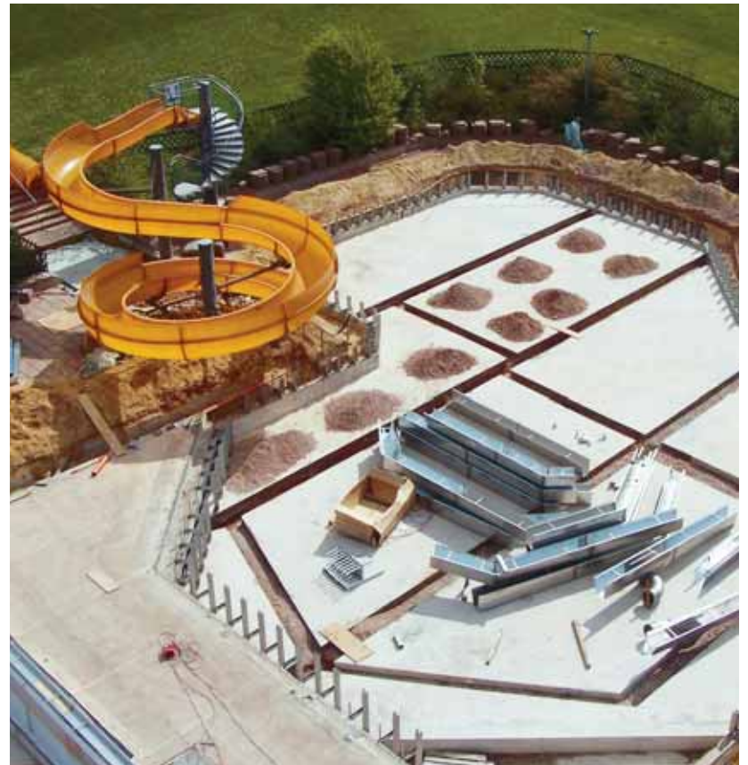
Die Arbeiten für die Edelstahlauskleidung gehen zügig voran. Unser Bild zeigt das Erlebnisbecken aus der Vogelperspektive.